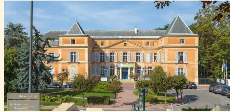
Mairie de Clichy-sous-Bois

Clichy-sous-Bois est également une ville dynamique proche de la capitale et des grands pôles économiques tels que Marne-la-Vallée et Roissy Charles-de-Gaulle. Sa bonne desserte routière (autoroutes A3 et A86) et son bon réseau de transports en commun avec le tramway T4 (qui permet de relier le RER B et le RER E en 20 minutes*) et l'arrivée prochaine de la ligne 16** du métro dans le cadre du Grand Paris Express permettent de concilier facilement vie professionnelle et vie personnelle. Au quotidien, les Clichois profitent d'un centre-ville convivial, de nombreux commerces, de cinq centres commerciaux, d'un marché de produits frais, de structures scolaires et d'une offre culturelle et sportive de qualité.