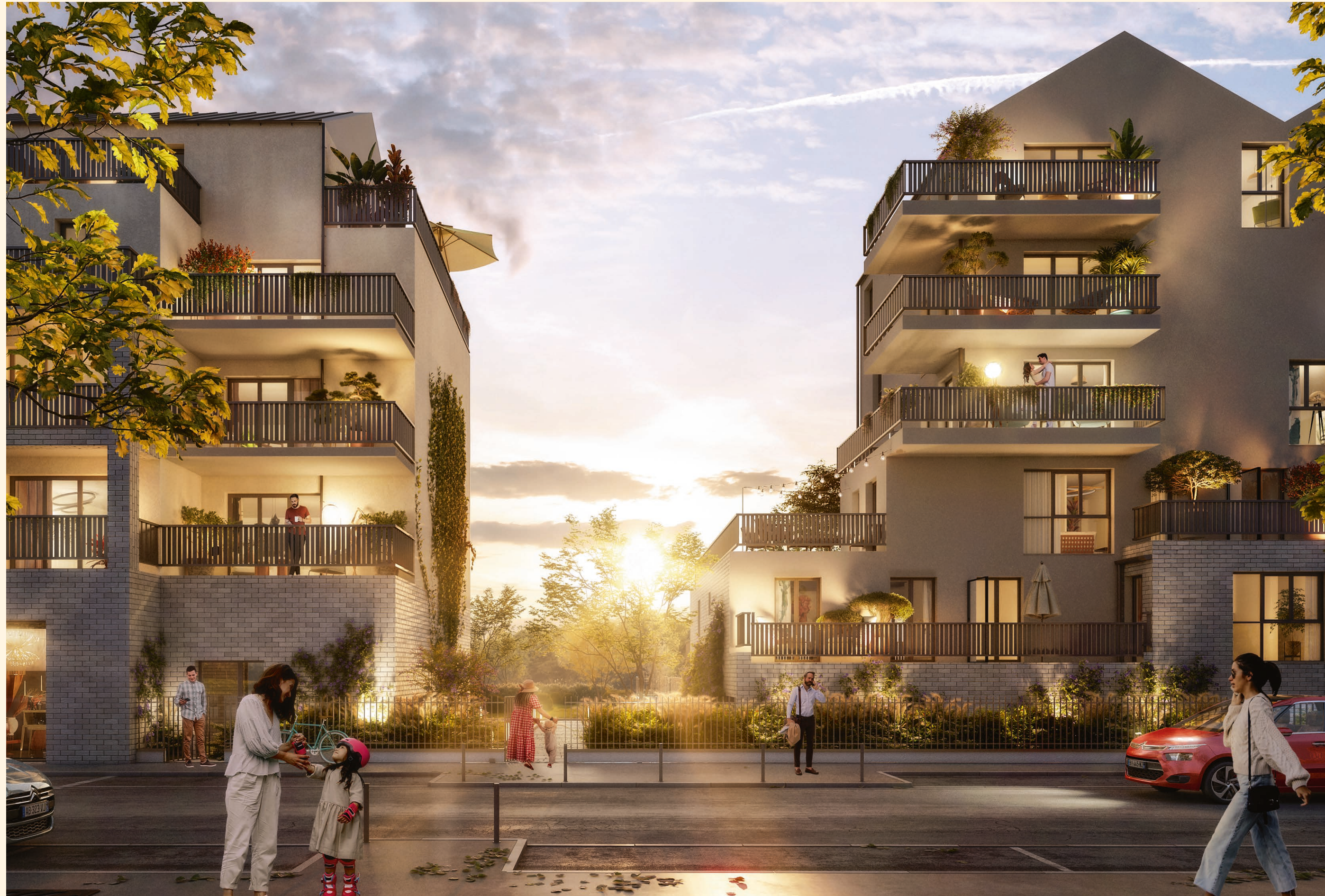
Vue depuis l'allée Jules Renard

Les toitures métalliques à deux pentes et les garde-corps finement ouvragés apportent un indéniable cachet à cette réalisation d'exception entièrement sécurisée.